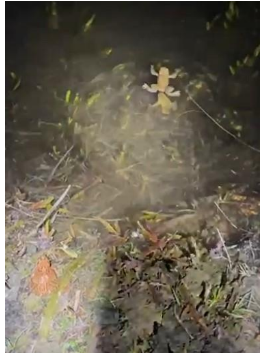
Ziel erreicht und gleich losschwimmen.

Wenn Ihr Zeit und Lust habt, am Hofgut Adenroth bei Breitenau abends bei Sternenhimmel mitzuhelfen, wir freuen uns auf jede hilfreiche Hand.