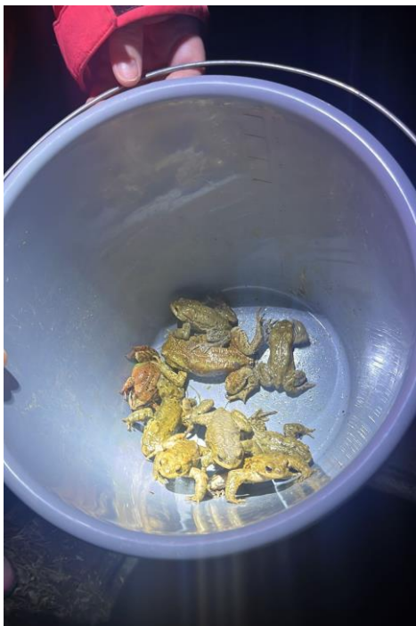
Auch ein Frosch hat sich dazugesellt

Derzeit ist es aufgrund der kalten, trockenen Nächten noch ruhig. Aber die Wanderung zum Teich kann jeden Tag beginne.