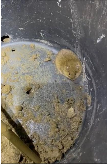
Der erste „Fang“ im Eimer. Wurde natürlich nicht im Teich ausgesetzt!.

Seit dieser Zeit werden die Zäune morgens und abends von Freiwilligen kontrolliert und die Tiere per „Taxi“ an den Teich gebracht.