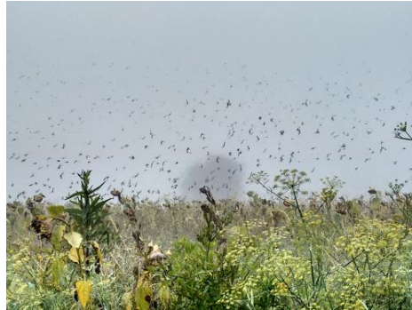
Nach der Störung setzten sich alle Vögel wieder auf die Fläche zum „auftanken“

Wir konnten an diesem Vormittag tolle Beobachtungen machen. Schwärme von Zugvögeln kamen zum Feld und stärkten sich für die Reise in den Süden. Hieran sieht man, wie wertvoll solche Flächen sind.