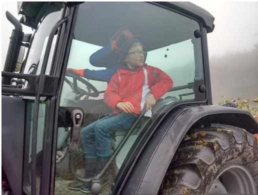
Jung und Alt beobachten die Zugvögel