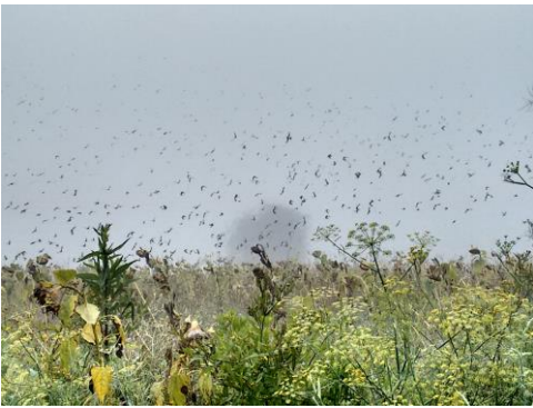
Foto des Monats Blühfeld Kurtscheid