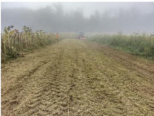
Peter bereitet die Fläche vor

Es wurde zuerst grob die Agroforstfläche eingemessen und dann markiert, wo die Obstbäume hingepflanzt werden könnten.