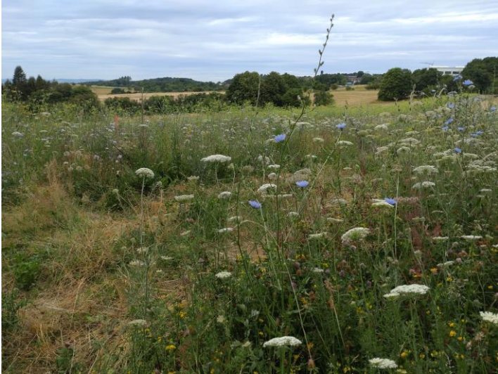
Ist die Natur nicht einfach herrlich?

Viele Tiere gibt es hier zu beobachten. Hase und Reh, Schmetterlinge und andere Insekten, Vögel, die nach Insekten suchen. Sogar ein Schwalbenschwanz wurde gesichtet. Vielleicht hat er hier einen Platz zur Eiablage gefunden.